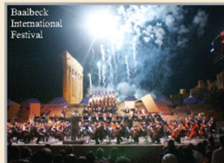
Baalbeck International Festival