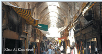
Khan Al Khayateen

Nad miastem góruje ogromna cytadela zbudowana w czasach wypraw krzyżowych przez Raymonda de Saint Gilles, założyciela hrabstwa Trypolisu. Zniszczona w znacznej mierze w okresie panowania Mameluków, twierdza była wielokrotnie przebudowywana przez kolejnych władców. Ta wspaniała cytadela o długości 120 m i szerokości 70 metrów jest jedną z najwspanialszych budowli tego typu na Bliskim Wschodzie. Warto odwiedzić również sławne łaźnie (po arabsku: hammam); niektóre z nich pochodzą z XIII wieku. Kopyta tych budowli mają szklane prześwitły, przez które światło przedostaje się do wnętrza. W Hammam al-Abid, jedynym funkcjonującym do dziś obiekcie tego rodzaju, można zażyć przyjemności autentycznej łaźni tureckiej.