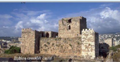
Byblos crusader castle

Byblos jest terenem bardzo ważnych wykopalisk archeologicznych, także z tego względu, że było miejscem narodzin alfabetu. Faktem jest, iż na sarkofagu fenickiego króla Ahirama, odkrytym w Byblos i wystawionym teraz w Muzeum Narodowym w Bejrucie, można zobaczyć najstarszą znaną nam inskrypcję w alfabecie fenickim.