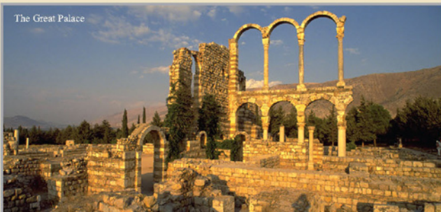
The Great Palace

Anżar został wpisany przez UNESCO na Światową Listę Zabytków Dziedzictwa Kulturalnego i Przyrodniczego.